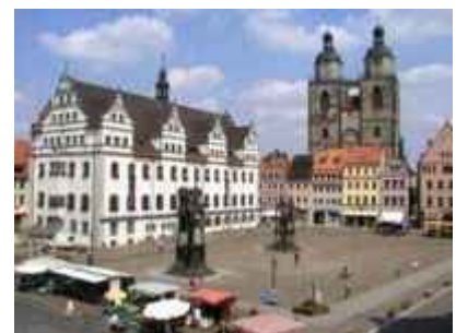
In der Lutherstadt Wittenberg wird nächstes Jahr der "Zukunftskongress" stattfinden

Der EKD-Ratsvorsitzende, Bischof Wolfgang Huber, unterstrich die Bedeutung des EKD-Vorstosses. Wenn die Kirche untätig bliebe, würde sie dramatisch an Handlungsfähigkeit verlieren, sagte Huber im Bayerischen Rundfunk: «Jetzt haben wir aber noch die Chance, gegenzusteuern, Handlungsspielraum zu gewinnen und dabei gleichzeitig den Rückenwind auszunutzen, der sich ja daraus ergibt, dass es ein neues Interesse an Kirche, an Glauben, an Religion gibt.»