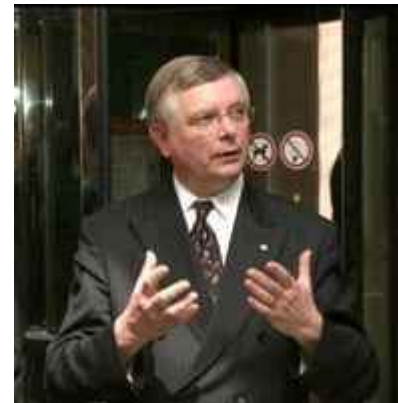
Begrüsst das Impulspapier: Der evangelische Bischof Axel Noack

Der schaumburg-lippische Bischof Jürgen Johannesdotter sieht das EKD-Papier mit Skepsis. «Das ist ein typisches Papier von Vertretern grosser Kirchen für grosse Kirchen», sagte er im niedersächsischen Bückeburg. Die Bedeutung der Konfession werde unter Wert gehandelt. Die lutherische, reformierte oder unierte Prägung dürfe nicht übergangen werden. Schaumburg-Lippe ist mit rund 63'000 Mitgliedern die zweitkleinste Kirche in der EKD. Johannesdotter lehnte eine Fusion seiner Landeskirche mit anderen ab.